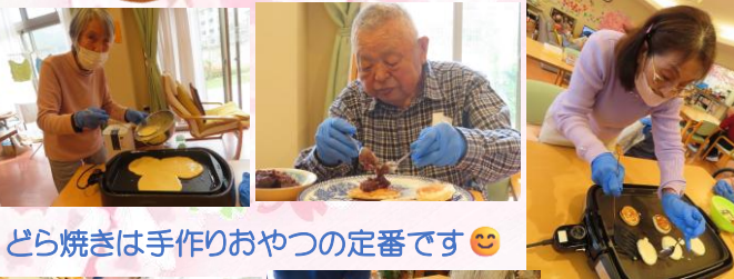
どら焼きは手作りおやつ定番です😊

3月・4月はみんなで協力して、たくさんのおやつ作りおやつを作りました。ホットケーキにどら焼き、おはぎ、ピザ、フレンチトーストなど盛りだくさんです。 ホームでのおやつ作りは、準備の時間から和気あいあいと会話が弾み、焼きあがるころには香ばしい香りが広がって、食欲をそそります。 主婦の大先輩の女性陣はもちろん、男性のみならずも意欲的に手伝って下さり、みんなで楽しく作ることができました。