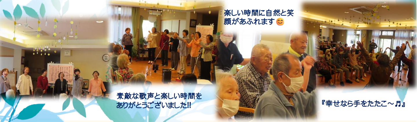
楽しい時間に自然と笑顔があふれます😊

また、当日の様子は動画でも撮影させていただき、来荘されていなかった利用者さまにも後日ご覧いただきました。あとから動画を見ながら一緒に歌を口ずさまれる方もおられ、皆さまで楽しい時間を共有することができました。