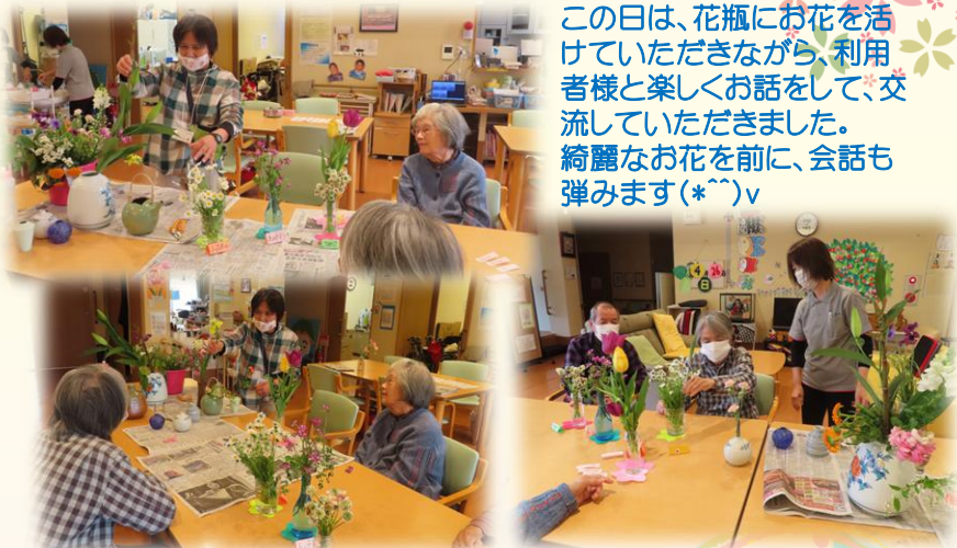
この日は、花瓶にお花を活けていただきながら、利用者様と楽しくお話をして、交流していただきました。綺麗なお花を前に、会話も弾みます(*^^)v

これからも地域とのつながりを大切にしながら、皆さまに親しまれる施設を目指していききたいと思っております。