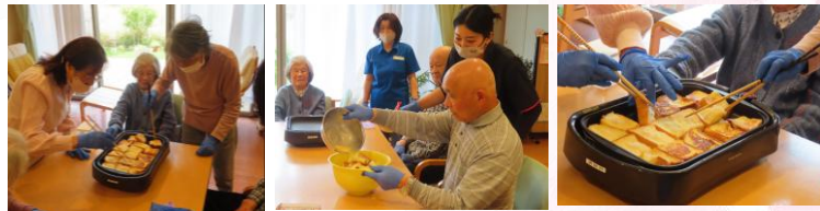
フレンチトーストは甘くて柔らかいので、食事の形態にかかわらず、みんなで一緒に食べられます(^^)／