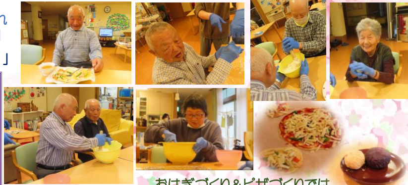
おはぎづくり&ピザづくりでは少し力が必要な作業も、難くこなして下さいます

特におはぎづくりやピザづくりでは男性陣が大活躍！ピザ生地をこねたり、おはぎ用のごはんをつぶしたりと、「任せとき！」と頼もしい姿を見せてくださいました。 さまざまな手作りおやつで大いに盛り上がり、楽しい『食欲の春』となりました。