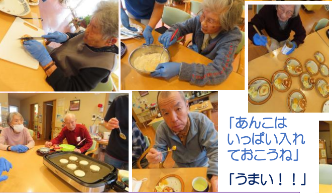
「あんこはいっぱい入れておこうね」 「うまい!!」