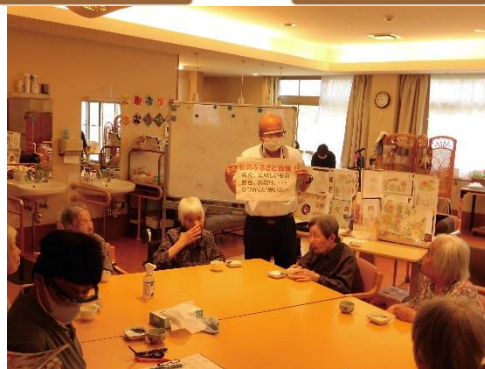
ふるさとの思い出を語り合いました

「回想法」は昔の経験や思い出を語り合う、昔を懐かしんで話をされている時は、自然と穏やかな表情になられますね！