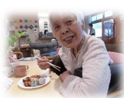
お腹いっぱい、大満足のバーベキュー大会でした～☆！