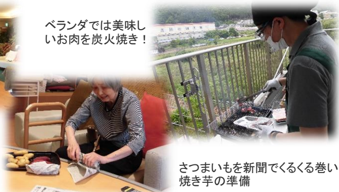
さつまいもを新聞でくるくる巻いて焼き芋の準備