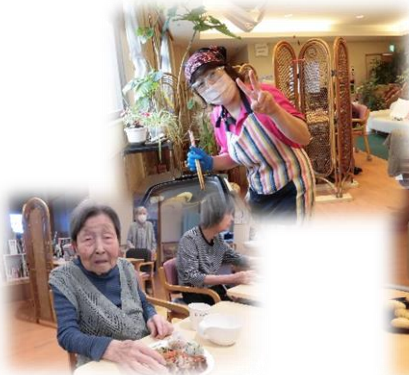
ベランダでは美味しいお肉を炭火焼き！